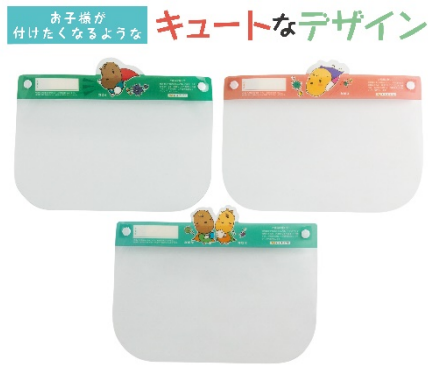
お子様にぴったり 小さめサイズ です 【約幅290mm×高さ200mm】

紙製品、文房具の製造、輸入、販売等をおこなう株式会社 YKC Japan（本社：千葉県千葉市、以下 YKC Japan）は 2020 年 10 月 12 日（月）に子供用のフェイスシールドを販売開始することをお知らせいたします。キッズ用（幼稚園・保育園生向け）とスクール用（小学生向け）の 2 種類です。スポンジタイプのため、身長の高い子供でも頭上からの飛沫を防ぎます。