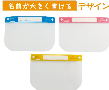
お子様にぴったり 小さめサイズ です 【約幅290mm×高さ200mm】